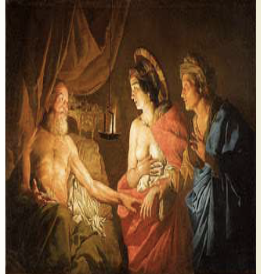
Sara présentant Agar à Abraham Matthias Stomer, 1600 - 1650